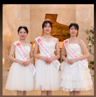
神戸ウエディングワイン